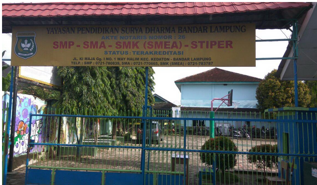
Gambar 2. Yayasan Pendidikan Surya Dharma Bandar Lampung

Kegiatan pengabdian dimulai dengan melakukan pengamatan/survei lapangan yang dilanjutkan dengan wawancara guru SMK Surya Dharma. Hasil didapat bahwa umumnya guru-guru di sekolah tersebut tidak mengenal dan memahami penggunaan aplikasi/perangkat lunak filmora dan window movie maker . Hal ini terlihat 90% saat jejak pendapat di pelatihan. Namun dengan adanya pelatihan ini, luaran dari kegiatan pengabdian ini adalah pengenalan, dan pemahaman tentang cara membuat video untuk media pembelajaran di sekolah. Dokumentasi pembukaan kegiatan pengabdian pada masyarakat yaitu pelatihan pembuatan media pembelajaran berbasis komputer ditunjukkan pada Gambar 2 dan Gambar 3