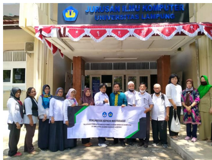
Gambar 4. Pelaksanaan Kegiatan Pelatihan di Laboratorium Rekayasa Perangkat Lunak (RPL) Jurusan Ilmu Komputer FMIPA Unila

Kegiatan pertama dilakukan pre-test yang bertujuan untuk menilai kemampuan dari peserta sebelum kegiatan dilaksanakan. Selanjutnya pelatihan ini dilakukan dalam dua sesi. Sesi pertama memberikan pengenalan terkait media pembelajaran dengan menggunakan video, beserta tutorial membuat video dengan perangkat lunak yaitu Filmora dan Window Movie Maker . Perangkat lunak ini berfungsi sebagai editing video . Kegiatan terakhir dilakukan post-test adalah untuk mengetahui hasil kemampuan setelah dilakukan pelatihan.