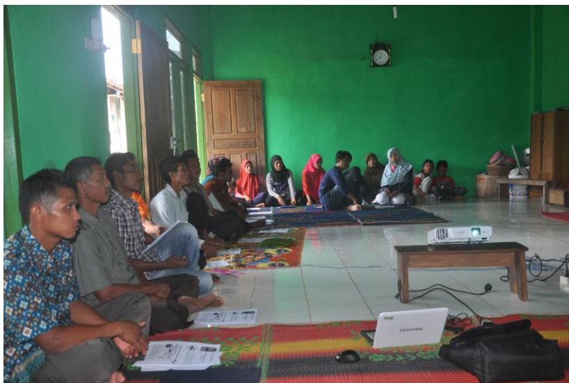
Gambar 2. Contoh Dokumentasi Foto [Palatino Linotype 9pt, bold, centered] ↓12pt

Bagian ini merupakan deskripsi bagaimana kegiatan dilakukan untuk mencapai tujuan. Jelaskan indikator tercapainya tujuan dan tolak ukur yang digunakan untuk menyatakan keberhasilan dari kegiatan pengabdian (Padma Shri & Sriraam, 2017). Uraikan juga keunggulan dan kelemahan luaran atau fokus utama kegiatan dilihat dari kesesuaian kondisi masyarakat di lokasi kegiatan dengan kondisi yang diharapkan. Jelaskan juga tingkat kesulitan pelaksanaan kegiatan maupun produksi barang/jasa serta kemungkinan perluasan/pengembangannya pada masa yang datang.