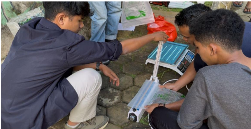
Gambar 6. Pengemasan Produk

Setelah granul dipastikan benar-benar kering, produk dikemas menggunakan plastik dan disegel dengan alat sealer seperti ditunjukkan pada Gambar 6. Pengemasan yang rapi memastikan pupuk organik granul tetap terlindungi dari kelembaban udara selama penyimpanan maupun distribusi ke konsumen atau anggota kelompok tani (Khozin, et al., 2025).