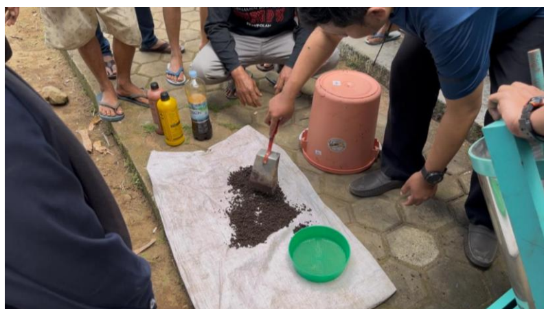
Gambar 5. Pengeluaran dan Penjemuran Granul

Setelah pencetakan selesai, granul yang dihasilkan segera dikeluarkan dari mesin lalu disebar secara merata di atas terpal pada area terbuka untuk penjemuran (Gambar 5). Penjemuran dilakukan di bawah sinar matahari selama 3 hingga 5 hari, dengan pengadukan atau pembalikan