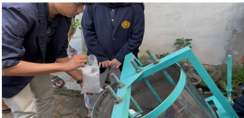
Gambar 3. Pencampuran Bahan