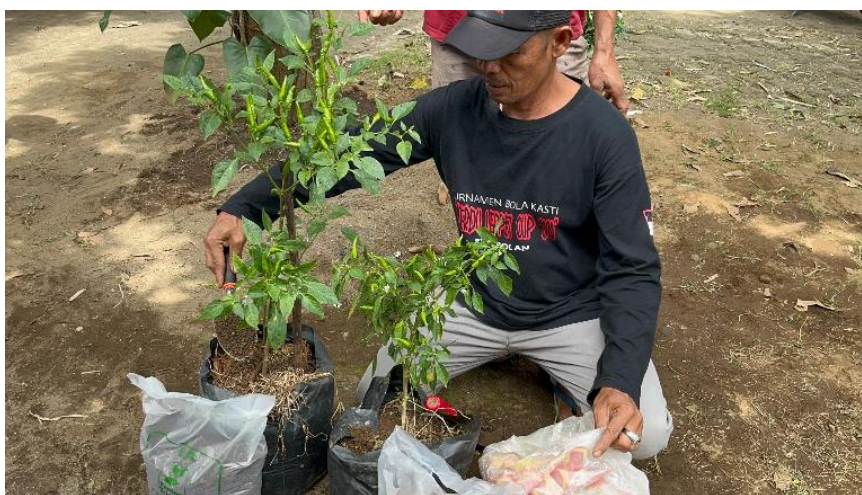
Gambar 7. Pengaplikasian pada Tanaman

Setelah granul dipastikan benar-benar kering, produk dikemas menggunakan plastik dan disegel dengan alat sealer seperti ditunjukkan pada Gambar 6. Pengemasan yang rapi memastikan pupuk organik granul tetap terlindungi dari kelembaban udara selama penyimpanan maupun distribusi ke konsumen atau anggota kelompok tani (Khozin, et al., 2025).