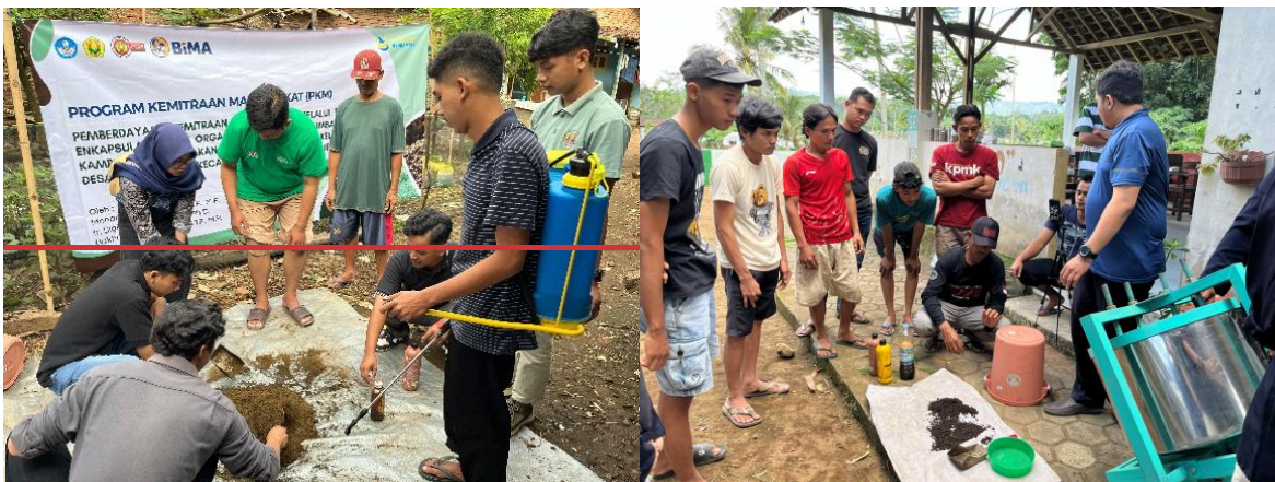
Gambar 2. Persiapan Bahan dan Peralatan Sebelum Sosialisasi dan Demonstrasi

Gambar 2 menunjukkan proses persiapan seluruh bahan yang diperlukan, seperti kotoran kambing yang sudah difermentasi, tepung kanji sebagai perekat, dan Trichoderma sp. sebagai agen hayati, beserta peralatan seperti wadah pencampur, alat cetak sederhana, saringan, dan terpal untuk penjemuran.