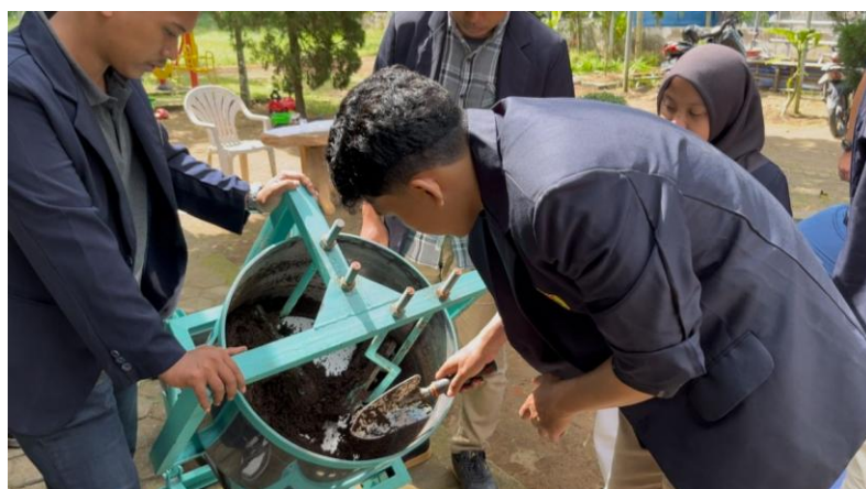
Gambar 4. Proses Pencetakan Otomatis

Gambar 4 menunjukkan proses mencetak pupuk organik yang telah terfermentasi menjadi butiran granul yang berukuran seragam secara merata. Proses ini berlangsung sekitar 30 menit untuk satu kali pembuatan, sehingga sangat efisien baik dari sisi waktu maupun tenaga.